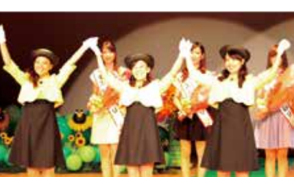
▲第28代ミスひまわりコンテスト