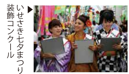
いせさき七夕まつり 装飾コンクール