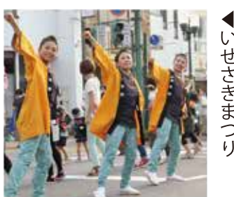
ダンピアいせさき いせさきまつり