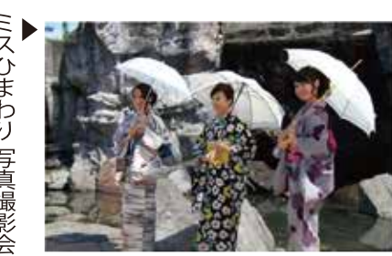
ミスひまわり写真撮影会