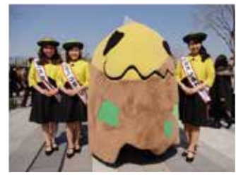
いせさきもんじゃまつり