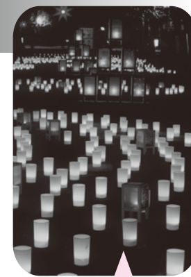
当日17:30からのロウソクの点火は、どなたでも参加できますので、ぜひ体験してみてください!

サブ会場である赤石楽舎では、歴史遺産である旧時報鐘楼のライトアップとろうそくの灯りのコラボレーションが、幽玄な雰囲気醸し出します。