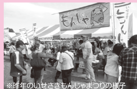
※昨年はいせさきもんじゃまつりの様子