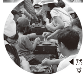
▲黙々とチャレンジする参加者