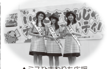
▲ミスひまわりも応援