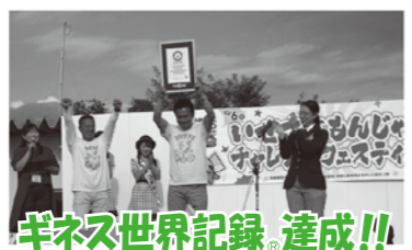
ギネス世界記録®達成!!