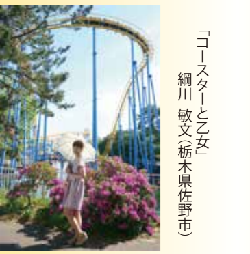
「コースターと少女」 網川 敏文(栃木県佐野市)