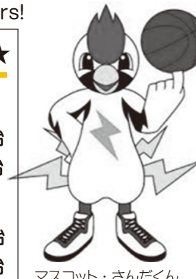
マスコット・さんだくん

チケット情報 → 群馬クレインサンダース公式HP http://www.g-crane-thunders.jp/