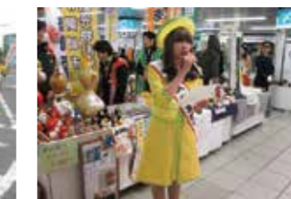
池袋駅でも観光PRを行いました