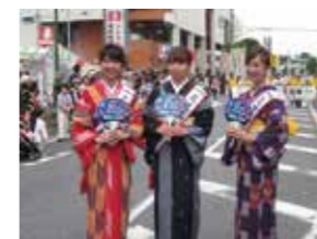
いせさきまつりのオープニングパレードにて