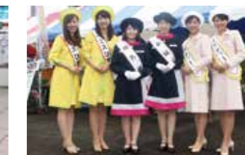
他市のミスと合同で観光キャンペーン