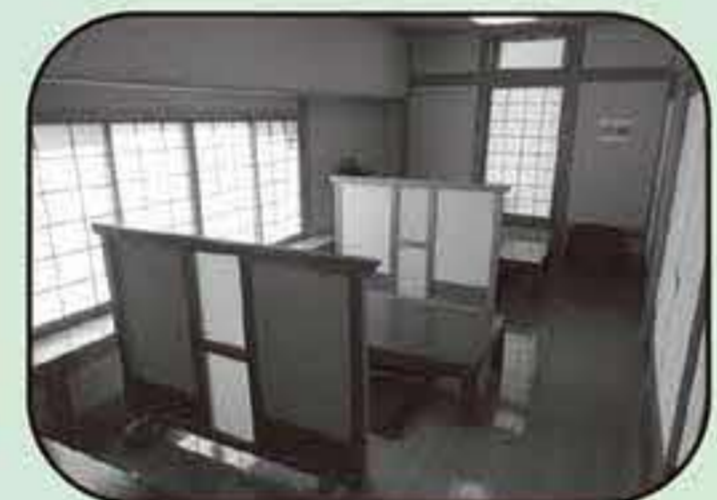
▲仕切りがあるので安心して食事ができます